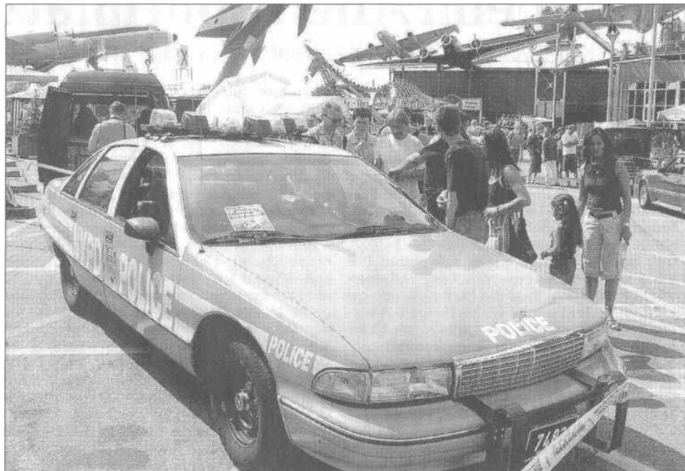
Blickfang für Besucher: Original Polizeifahrzeuge aus New York.

Im Laufe der Jahre wird in unzähligen Arbeitsstunden aus dem Serienauto ein fast unbezahlbares Einzelstück. Die Zeiten für die großen Ami-Schlitten scheinen aber vorbei zu sein, denn neben TÜV, Katalysator und KFZ-Steuer reißt der hohe Spritverbrauch ein tiefes Loch in den Geldbeutel. Hinzu kommt, dass die Szene ausgedünnt wird. Denn bei früheren Treffen zeigten viele Angehörige der hier stationierten US-Armee ihre Vehikel. Der Truppenabzug hinterlässt auch hier sein Spuren. Dennoch lebt die Traditionsveranstaltung in Sinsheim in erster Linie von Kontinuität, denn über Zweidrittel der Teilnehmer kommen jedes Jahr hierher.